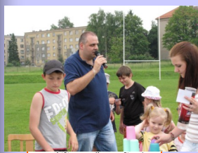
umístěte sem zajímavou větu nebo

Letošní Den dětí byl úspěšný, i když nepřišli všichni žáci, se kterými se počítalo. Rodičovský výbor i výbor klubu děkuje všem, kdož s jeho organizací pomohli, starším žákům, juniorům a dívkám. Poděkování samozřejmě patří také všem rodičům, kteří vypomohli ať už na místě, nebo přispěli různými dobrůtkami pro naše děti.